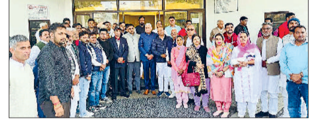
कैथल। जजपा की कर्मचारी व मजदूर प्रकोष्ठ की जिला स्तरीय मीटिंग में उपस्थित पदाधिकारी व कार्यकर्ता।

बूथ स्तर पर पार्टी को मजबूत करने का दिया निर्देश