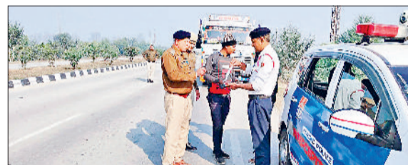
कैथल। यातायात नियमों का पालन न करने वालों का चालान करती पुलिस।