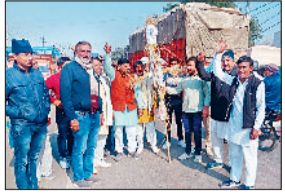
जीद। राहुल गांधी का पुतला फूंकते भाजपा किसान मोर्चा के पदाधिकारी।