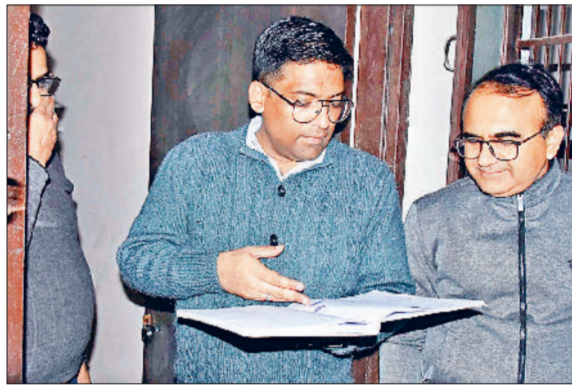
पालिका बाजार में बनाए गए रैन बसेरे में रजिस्टर जांचते उपायुक्त।

भी उपलब्ध करवाएंगे। सर्दी पिछले वर्ष रैन बसेरा में सर्दी के दिनों में 165 लोग जो किसी कारणवश बस स्टैंड पर फंसे थे वे यहां रुके थे। पालिका बाजार में बनाए रैन बसेरे में सुविधाओं को जांचा: पालिका बाजार स्थित नगरपरिषद द्वारा बनाए गए रैन बसेरा में डीसी गए और वहां उन्होंने रैन बसेरा में दो जाने वाली सुविधाओं को जांचा।