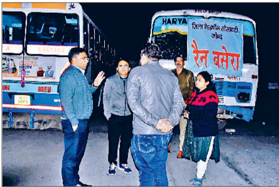
जींद। बस अड्डा पर बनाए गए रैन बसेरे का जायजा लेते डीसी।

जिला प्रशासन के अधिकारी रात के समय सार्वजनिक स्थानों जैसे रेलवे स्टेशन, बस अड्डे का निरीक्षण कर रहे