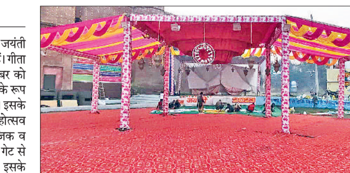
कैथल। गीता जयंती समारोह को लेकर सजाया गया भाई उदय सिंह का किला।

जिला प्रशासन द्वारा जिला स्तरीय गीता जयंती महोत्सव की तैयारियां पूरी कर ली गई हैं। गीता जयंती महोत्सव का आगाज 22 दिसंबर को महत्व यज्ञ से होगा, जिसमें मुख्यातिथि के रूप में विधायक लीला राम शिरकत करेंगे। इसके बाद प्रदर्शनी का शुभारंभ भी होगा। महोत्सव की श्रृंखला में 23 दिसंबर को सामाजिक व धार्मिक संस्थाओं के सहयोग से माता गेट से भव्य शोभा यात्रा निकाली जाएगी। इसके साथ-साथ 22 व 23 दिसंबर को सायं कालीन सांस्कृतिक कार्यक्रम का आयोजन भी होगा। डीसी प्रशांत पंवार ने कहा कि भाई उदय सिंह किला परिसर में 22 दिसंबर को ही सायं 5 बजे सांस्कृतिक कार्यक्रमों का आयोजन होगा, जिसका शुभारंभ बतौर मुख्यातिथि नगर